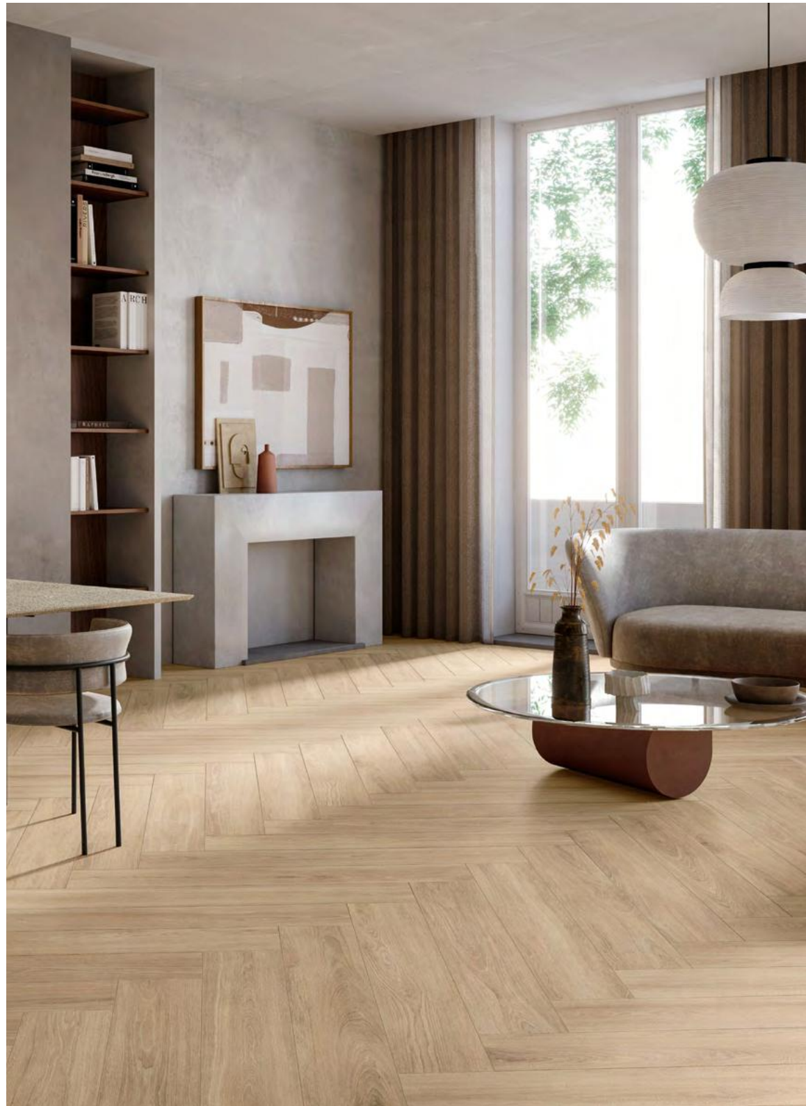
FLOOR: snowdonia cm 20x120 - 7 7 / 8 "x47 1 / 4 "