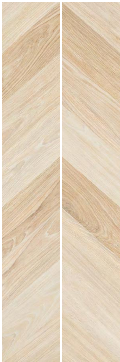
cm 20x120 - 7 7 / 8 "x47 1 / 4 "