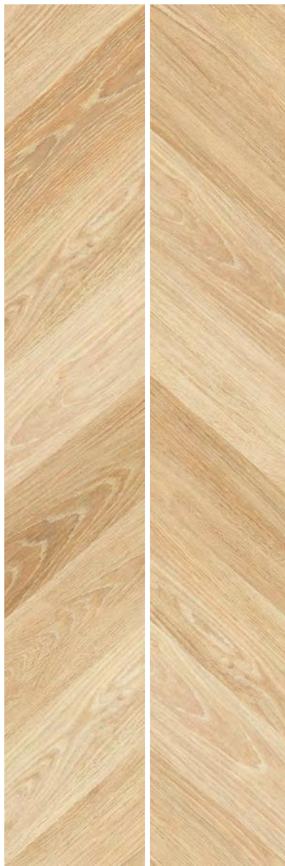
cm 20x120 - 7 7 / 8 "x47 1 / 4 "