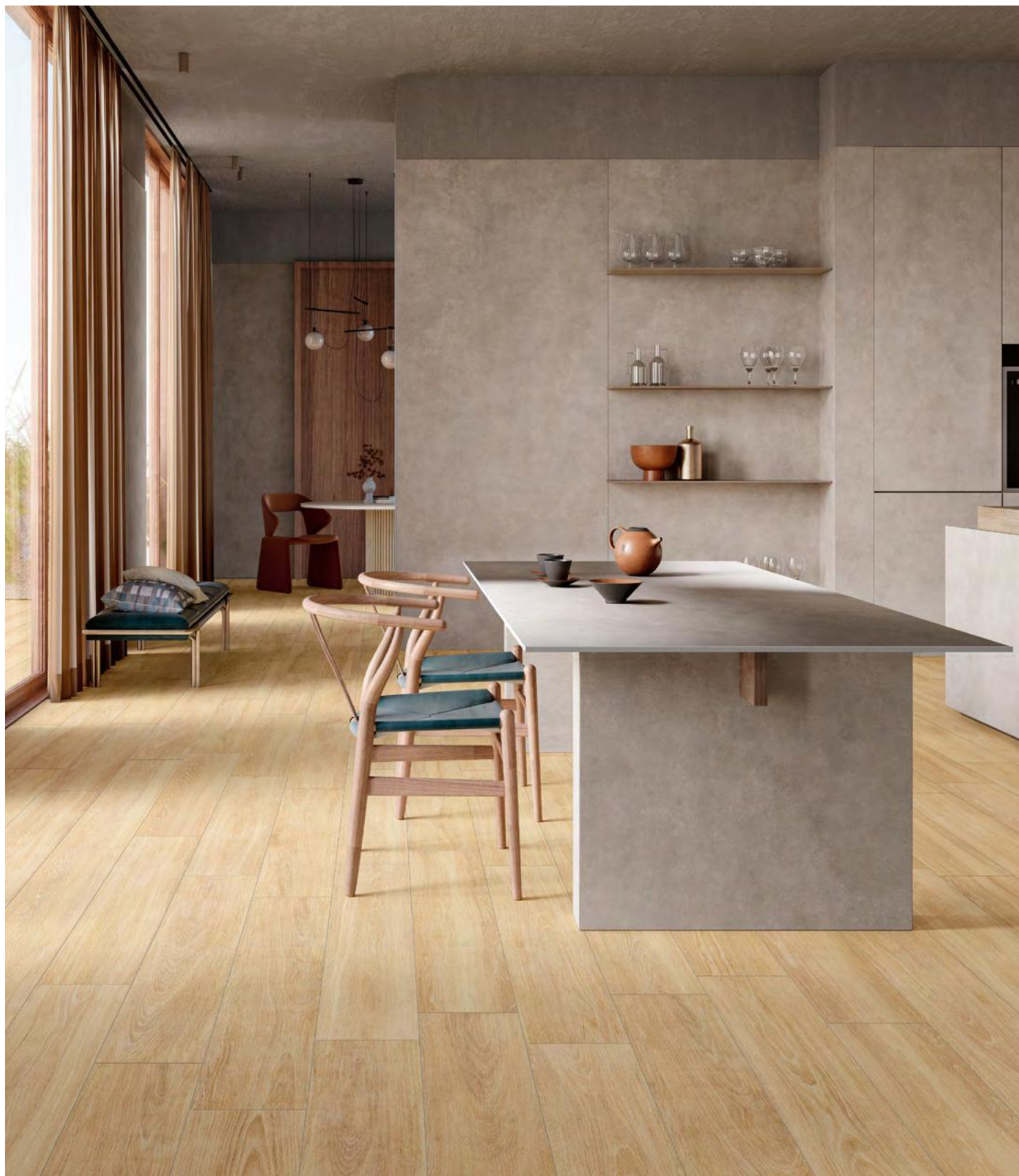
WALL: metropolis silver cm 120x278 - 47 1/4 "x109 1/2 " / FLOOR: english wood cheshire cm 20x120 - 7 7/8 "x47 1/4 "