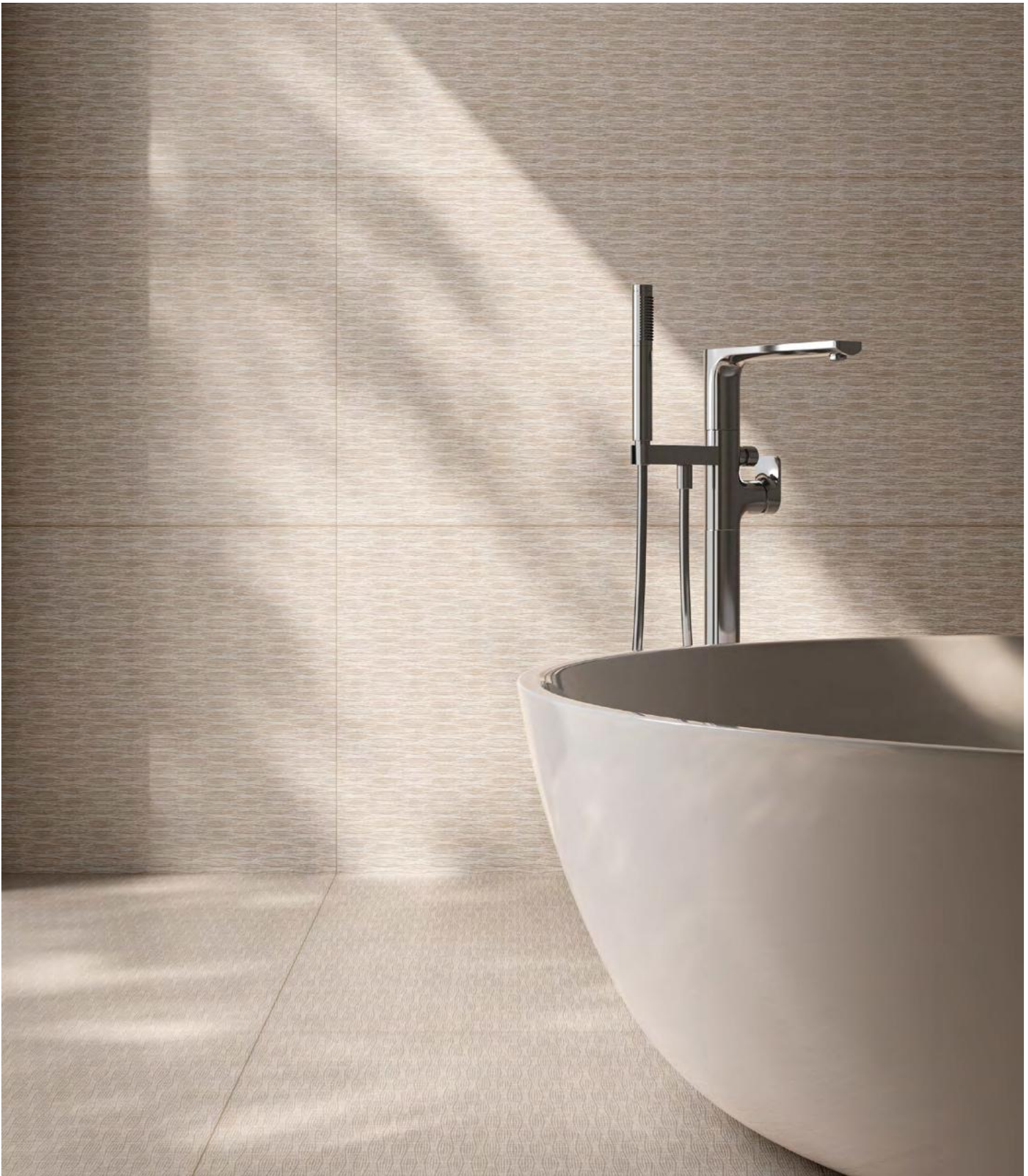
WALL: city london, metropolis sand cm 60x120 - 23 5/8 "x47 1/4 " / FLOOR: city london cm 60x120 - 23 5/8 "x47 1/4 "