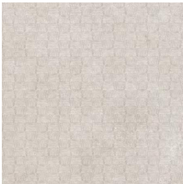
city hong kong